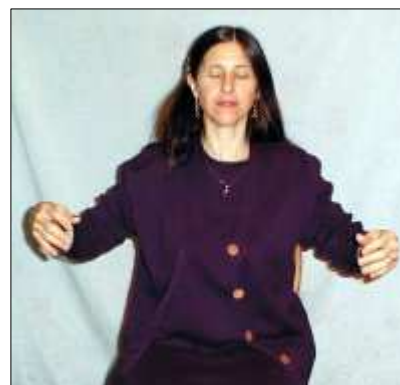
Ukončenie – očistenie rúk